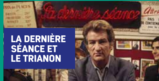
LA DERNIÈRE SÉANCE ET LE TRIANON

La soirée sera inaugurée par le cinéaste Costa-Gavras , compagnon de longue date du Trianon en tant que parrain d'honneur du Festival du Film Franco-Arabe.