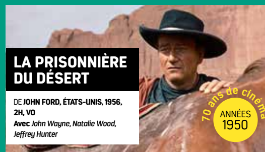
LA PRISONNIÈRE DU DÉSERT

DE JOHN FORD, ÉTATS-UNIS, 1956, 2H, VO Avec John Wayne, Natalie Wood, Jeffrey Hunter